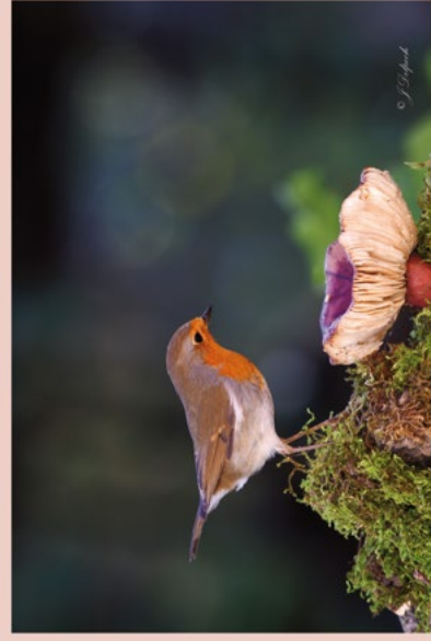
Le rouge Gorge